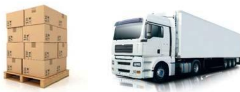
Plate-forme de distribution, transporteur